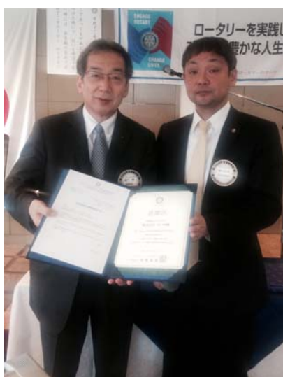
表彰される織戸会員