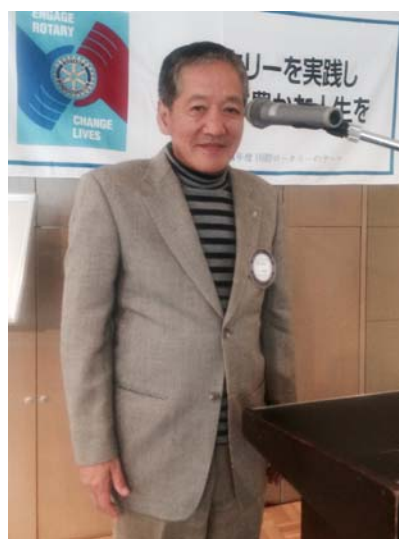
卓話をする瀧会員